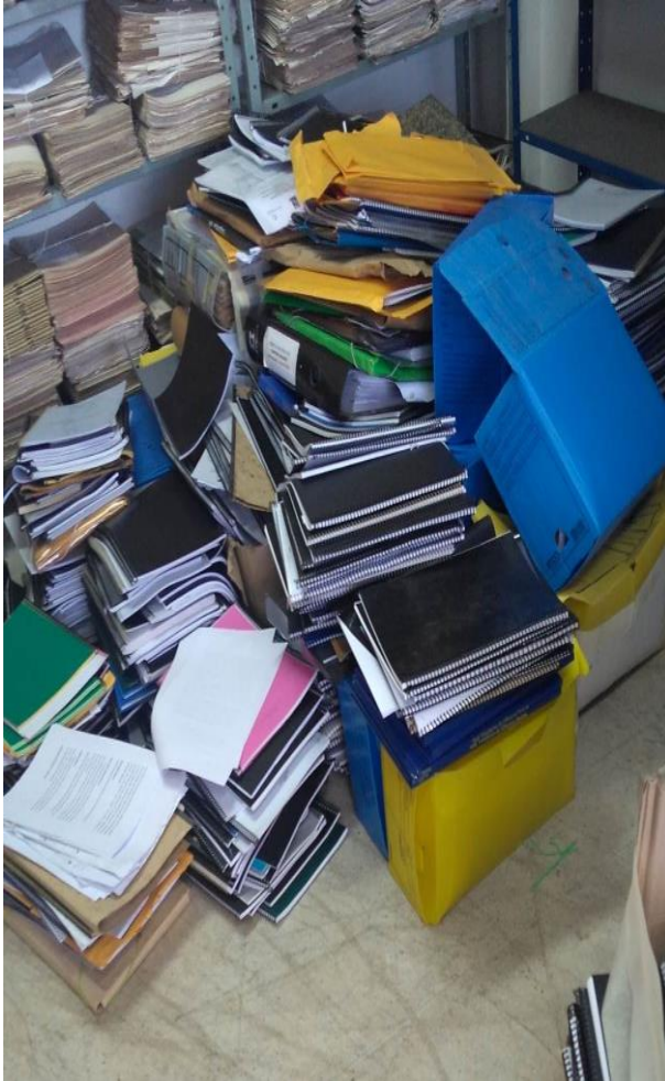
Fotografia 08 – Massa Documental do Programa Nacional da Escola de Gestores