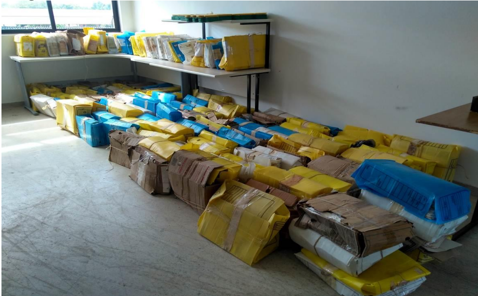
Fotografia 05 – Parte do Volume Documental 1