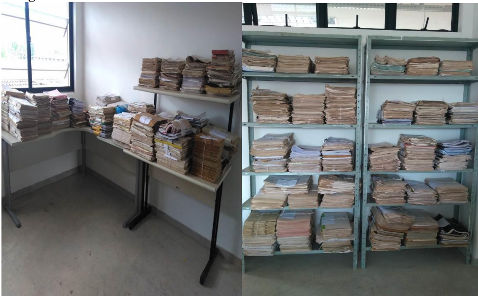
Fotografia 06 – Documentos retirados das caixas do Volume 1

Em seguida, foi realizada a retirada dos documentos que se encontravam nas caixas, devido ao estado de conservação dos mesmos. Assim, os documentos retirados ficaram acondicionados apenas em estantes de aço e sobre uma mesa, amarrados em barbantes.