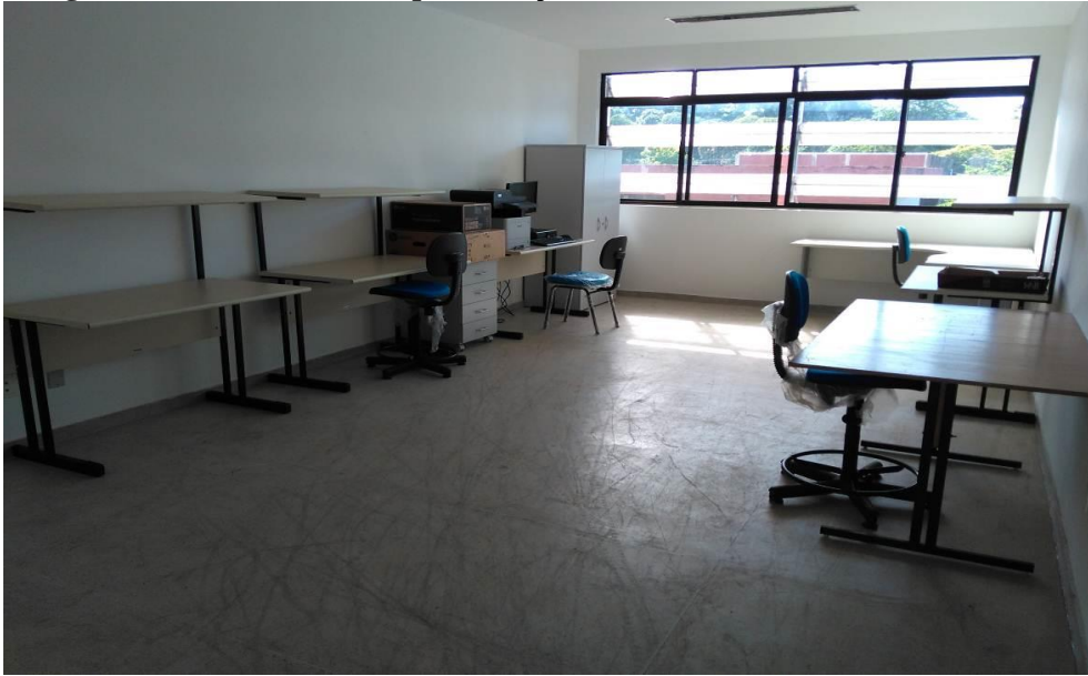
Fotografia 03 – Sala 04