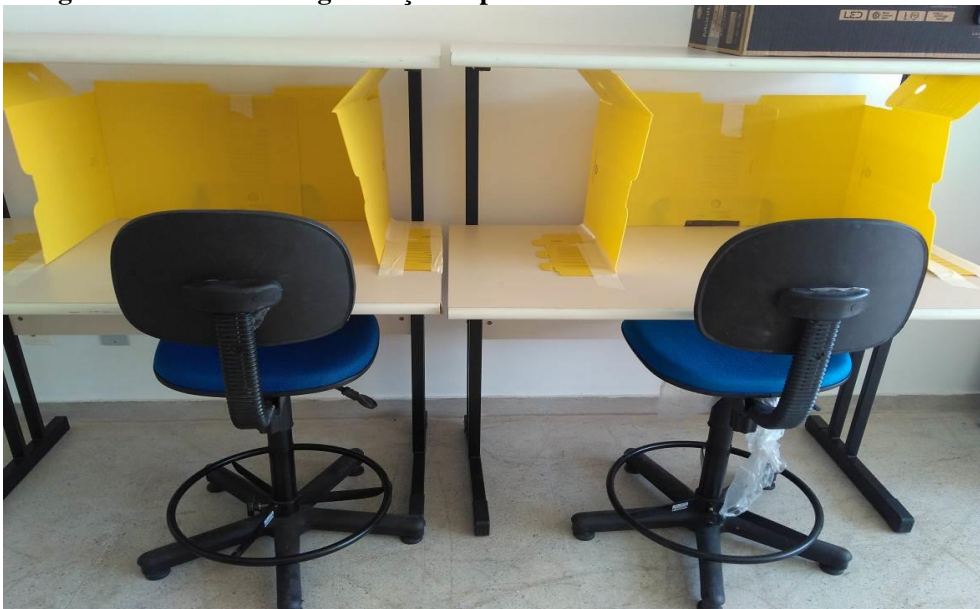
Fotografia 04 – Área de higienização improvisada