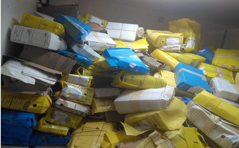
Fotografia 01 – Arquivo Setorial - Massa acumulada do Volume Documental 1

medidas, então temos: 2,60 \text{ m} \times 2,15 \text{ m} \times 2,50 \text{ m} = 13,975 \text{ m}^3 . Com isso, para converter os resultados encontrados em metros lineares é preciso multiplicar os resultados em \text{m}^3 por 12, então temos: 13,975 \text{ m}^3 \times 12 = 167,7 metros lineares. Desse modo, o Volume Documental 1 possui 167,7 metros lineares de massa documental acumulada.