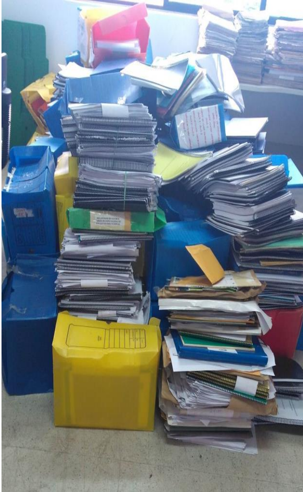
Fotografia 07 – Massa Documental da PPGE

Educação Básica Pública (PNEGEB), com o objetivo de executar procedimentos arquivísticos necessários para o tratamento e organização desses documentos. O Programa de Pós-Graduação em Educação “oferece os cursos de Mestrado e Doutorado. Constituído por cinco linhas de pesquisa e tendo como foco principal a educação básica no Nordeste brasileiro” (UNIVERSIDADE..., 2016). Já o Programa Nacional Escola de Gestores da Educação Básica busca “qualificar os gestores das escolas da educação básica pública, a partir do oferecimento de cursos de formação a distância. A formação dos gestores é feita por uma rede de universidades públicas, parceiras do MEC” (BRASIL, 2018).