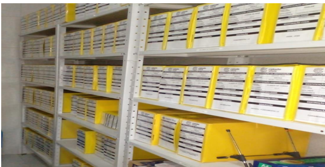
Imagem 3: Organização arquivística dos diários de classe da Escola Internacional Cidade

Dentre as documentações da escola, são recebidos os diários de classe (Imagem 3), que contêm as frequências, conteúdos e planejamento anual de todas as disciplinas e turmas da EICV. Esses diários são enviados ao arquivo trimestralmente. O procedimento de entrada é o mesmo das documentações anteriores, sendo obrigatório o envio do protocolo do remetente para a entrada dos documentos no setor. Após o preenchimento do protocolo interno no arquivo, constando todas as informações de recebimento na planilha, os diários são separados por turma e arquivados. É um documento permanente, pois nele estão comprovadas as informações dos conteúdos dados em sala de aula, em conjunto com a assiduidade dos alunos. Em hipótese alguma poderá ser eliminado. Há um sistema interno em que os diários são gerados, nele os professores inserem todas as informações necessárias, onde os diários são impressos, assinados e repassados para o arquivo.