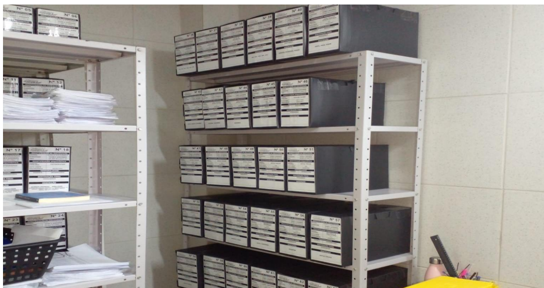
Imagem 2: Fundo arquivístico da Escola Nunes & Albuquerque

mais do ponto de vista da função e da execução das atividades. Cada procedimento tornou-se crucial para o aperfeiçoamento e conservação da mesma. A atividade de higienização e desmetalização ocorreram por etapas, de acordo com a ordem das caixas. Foram retirados grampos enferrujados e ligas deterioradas que estavam nos documentos.