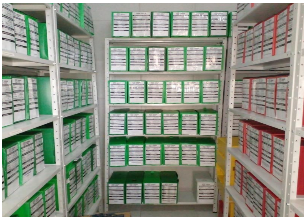
Imagem 4: Organização por fundos arquivísticos no contexto da Fundação Cidade Viva

Conforme citado anteriormente, o arquivo geral da Cidade Viva é constituído de tipologias oriundas de vários setores da instituição. Diante disso, a arquivista optou por representar cada fundo por uma determinada cor. A EICV é representada pela cor amarela, o Restaurante pela cor verde, o Raízes (restaurante externo no campus metropolitano) pela cor branca, a Fundação pela cor azul, a Igreja pela cor vermelha e a Faculdade em caixas de papelão de tom amarronzado. Na cor verde constam os documentos do Restaurante e as de cor vermelha representam todos os processos documentais da Igreja (Imagem 4).