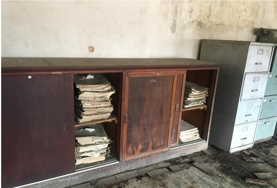
Imagem 13 – Móvel com documentações, registrado em 2019

armazenava parte dos documentos do acervo, porém, os mesmos foram retirados por funcionários da Matarazzo em São Paulo, segundo relatado pelo vigilante. O contato com a sede em São Paulo não obteve êxito, portanto não se sabe a destinação dos documentos e nem os motivos que os levaram a fazer isso.