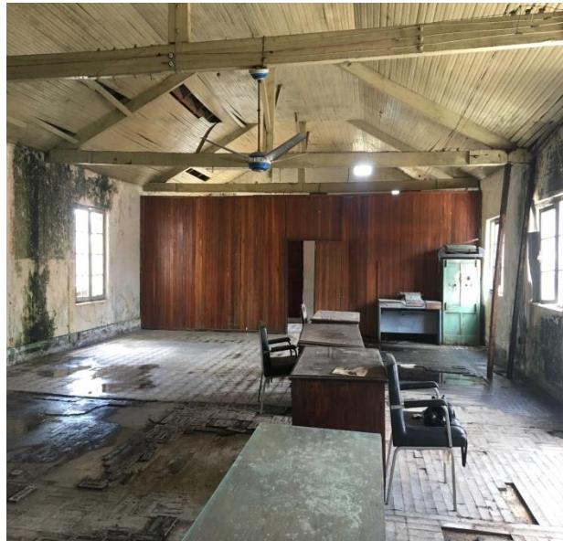
Imagem 11 – Ambiente da Administração (2019)