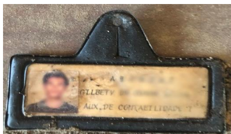
Imagem 4 – Crachá de identificação funcional de um auxiliar de contabilidade

Nas documentações analisadas foram identificados alguns dos cargos exercidos por funcionários na fábrica, como auxiliar de produção e contabilidade, segurança, químico, servente, médico, técnico em eletricidade, dentre outros. Devido ao grande equipamento industrial Matarazzo, sabe-se que existiam diversas outras funções, inclusive as não registradas formalmente. Em todo o país o grupo empregou em média 30.000 pessoas simultaneamente, espalhadas em 350 fábricas, quando atingiu seu auge na indústria brasileira.