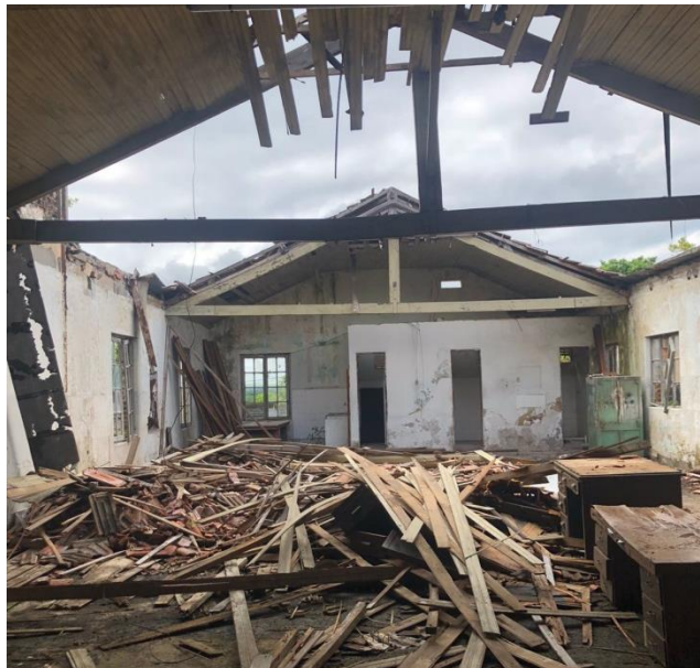
Imagem 12 – Antiga Administração (2023)