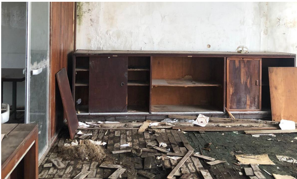
Imagem 14 – Móvel sem as documentações, registrado em 2023