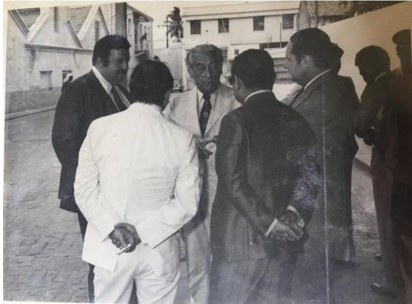
Imagem 7 – Empresários em visita à fábrica