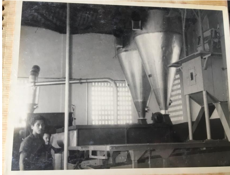
Imagem 9 – Ambiente da fabricação do farelo de algodão