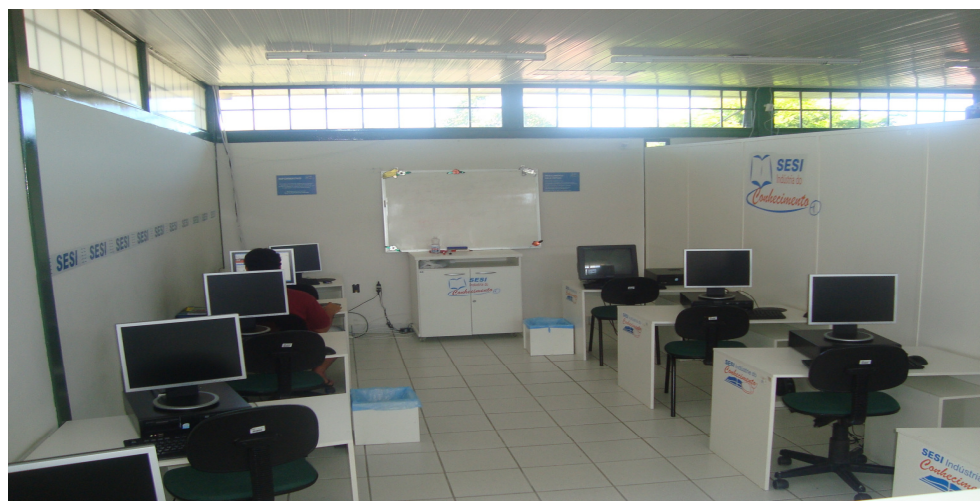
Figura 6. Sala de informática da Indústria do Conhecimento SESI.

Na sala de leitura encontram-se o acervo, seis mesas com 24 lugares para leitura, pesquisa e estudos, um televisor e um DVD. As estantes são acopladas à parede ficando o espaço da sala livre para a movimentação dos usuários. O ambiente é climatizado e conta com uma excelente iluminação. Na sala de informática, local destinado para as consultas on-line e a ministração dos cursos de informática oferecidos pela instituição, encontra-se nove computadores todos com acesso à internet. No balcão de atendimento também existe um computador e uma impressora para o processamento técnico.