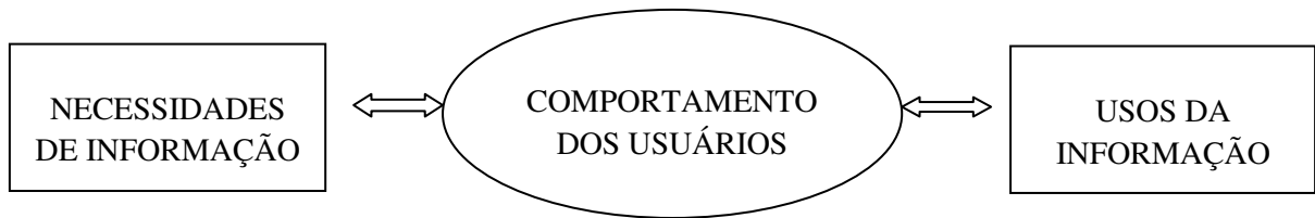
Figura 3. Usos e necessidades de informação Fonte: LE COADIC , 1996, p. 40

O uso da informação é algo muito pessoal, pois o seu significado está ligado diretamente ao contexto e a utilidade a que a mesma servirá. Assim, uma determinada informação pode ter importância, valor e/ou fazer sentido para uma pessoa e, no entanto, não causar nenhuma mudança para outra.