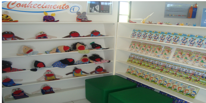
Figura 5. Gibiteca da Indústria do Conhecimento SESI.

Na sala de leitura encontram-se o acervo, seis mesas com 24 lugares para leitura, pesquisa e estudos, um televisor e um DVD. As estantes são acopladas à parede ficando o espaço da sala livre para a movimentação dos usuários. O ambiente é climatizado e conta com uma excelente iluminação. Na sala de informática, local destinado para as consultas on-line e a ministração dos cursos de informática oferecidos pela instituição, encontra-se nove computadores todos com acesso à internet. No balcão de atendimento também existe um computador e uma impressora para o processamento técnico.