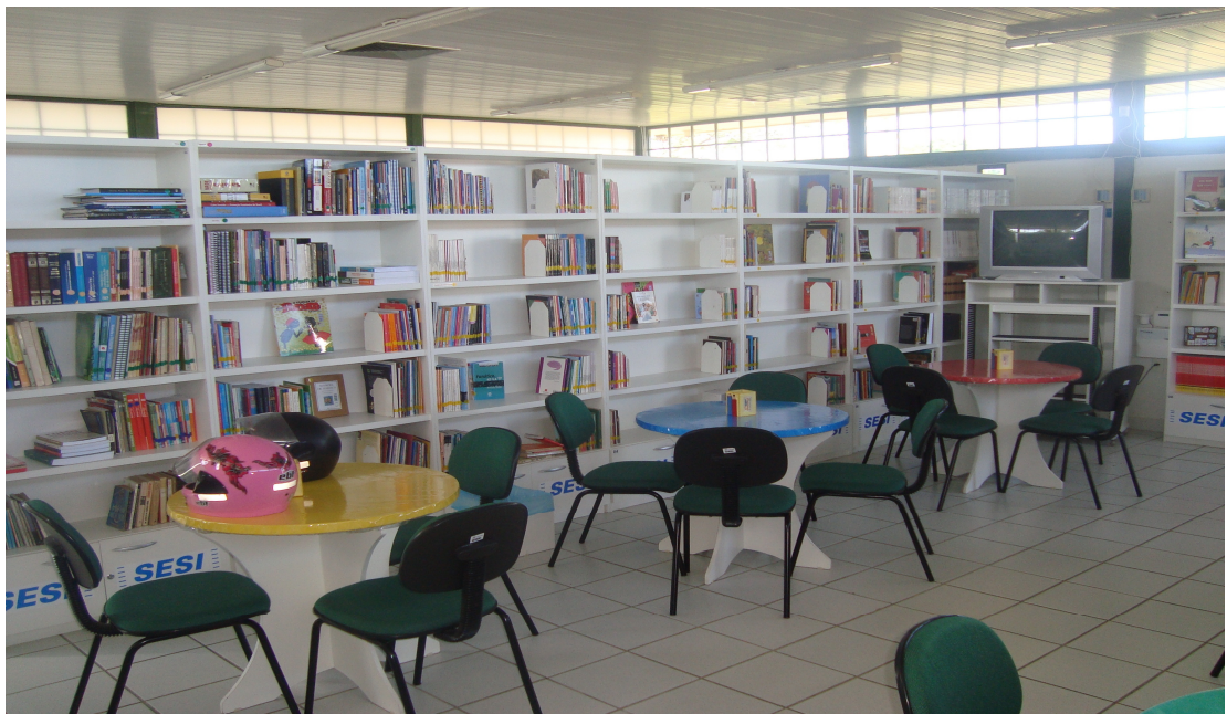
Figura 7. Sala de leitura e acervo da Indústria do Conhecimento SESI.

Os usuários têm acesso livre às estantes e os livros que compõem o acervo estão catalogados e distribuídos nas estantes por meio de um sistema de cores que identifica as áreas do conhecimento. (Apêndice B)