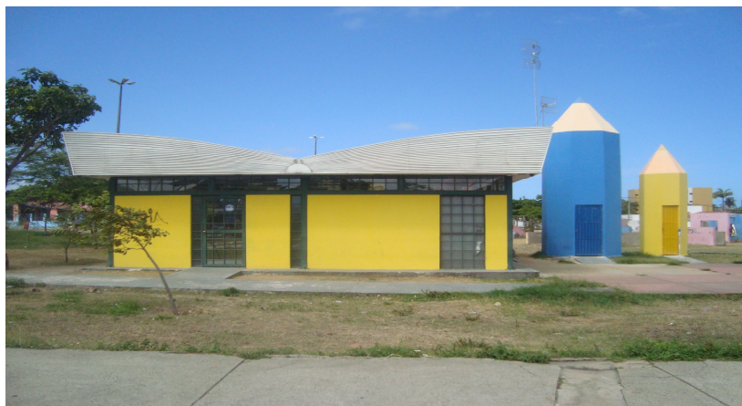
Figura 4. Design da Indústria do Conhecimento SESI.

Fisicamente, esta unidade de informação tem um design muito interessante. A biblioteca tem o formato de livro aberto e ao seu lado estão dois espaços em formato de um lápis de cor, onde, um lápis é uma espécie de depósito, onde são guardados alguns materiais da biblioteca e o outro é o banheiro. Conforme podemos ver na figura abaixo: