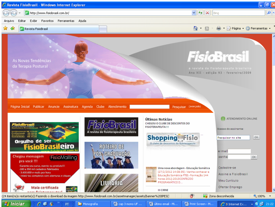
Figura 8: Tela ferramenta de busca da Revista Fisiobrasil

Os materiais recebidos são avaliados por fisioterapeutas pareceristas e analisados em sua qualidade, originalidade, inovação, contribuição para a fisioterapia e adequação ao perfil editorial da Revista.