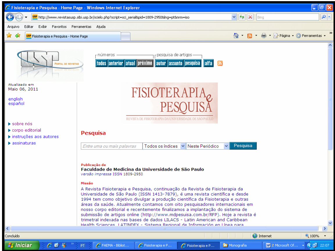
Figura 6: Tela ferramenta de busca da Revista Fisioterapia e pesquisa