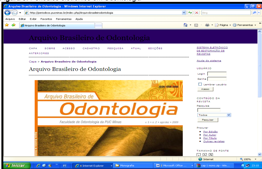
Figura 3: Periódico eletrônico em Odontologia