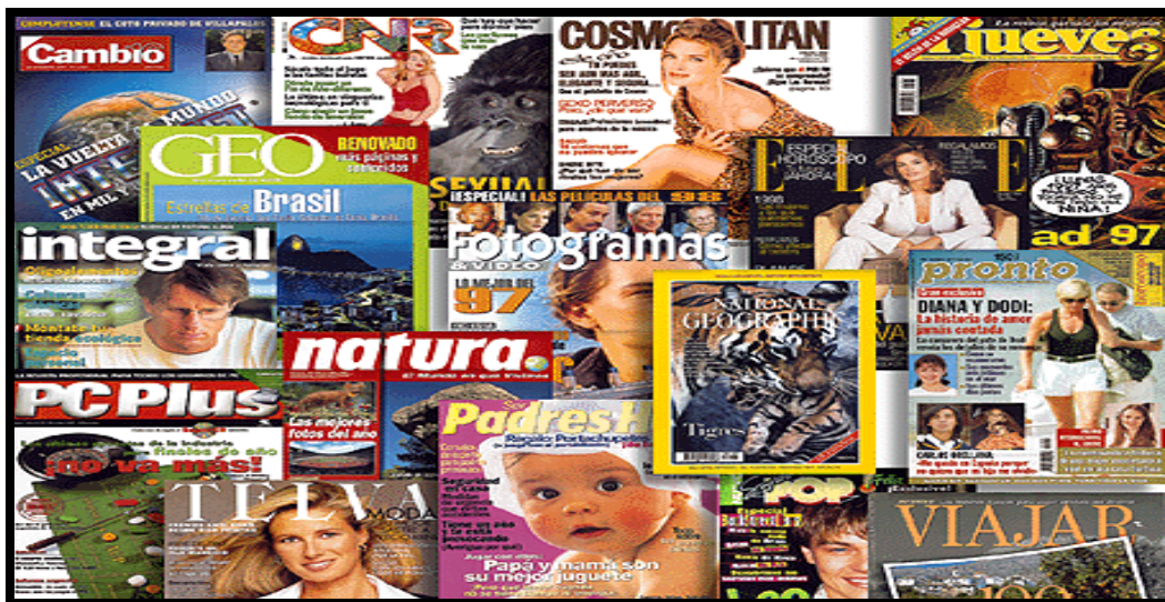
Figura 1: Periódicos comerciais