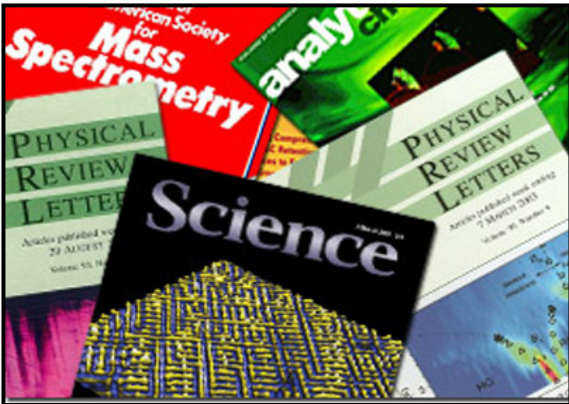
Figura 2: Periódicos acadêmicos científicos