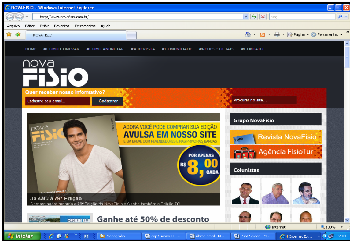
]Figura 9: Tela ferramenta de busca da Revista NovaFisio