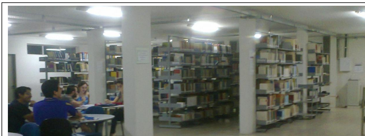
Figura 7 – Acervo de Referência, Informática, Estatística e Matemática

Neste primeiro piso concentra-se o acervo de Referência, Informática, Estatística e Matemática (Figura 7), como também três computadores a disposição dos usuários, sendo dois para que possam fazer pesquisas acadêmicas no Portal da Capes (Figura 8) e um para fazer consulta ao acervo (Figura 9). No segundo piso concentra-se o acervo de Física, Química, Geografia, Sistemática e Ecologia e áreas afins.