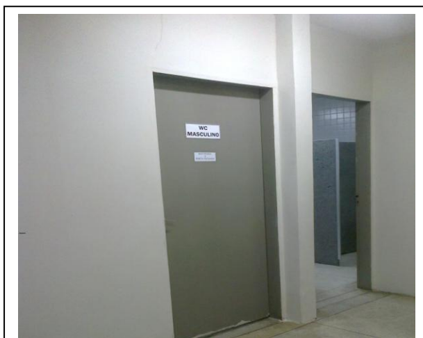
Figura 5 – Banheiros para uso dos usuários

Também fazem parte do primeiro piso o Setor de Processos Técnicos onde os bibliotecários desenvolvem todos os serviços técnicos da biblioteca; Setor de Restauração onde tem um bibliotecário responsável pela conservação e restauração de todo o acervo da biblioteca; a Administração, onde concentra todo o serviço administrativo da Biblioteca; a Copa que é de uso restrito aos servidores da biblioteca; como também uma despensa destinada à guarda de material de limpeza da biblioteca; os Banheiros femininos e masculinos de uso público (Figura 5); e também um bebedouro disponível para uso dos usuários (Figura 6).