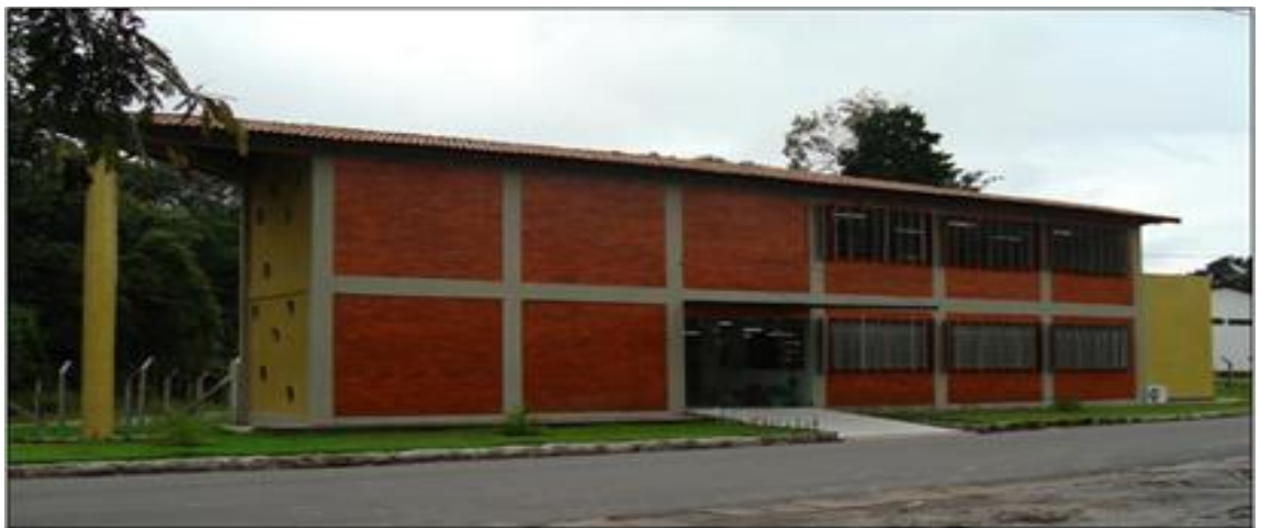
Figura 3 - Biblioteca Setorial do CCEN.