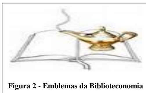
Figura 2 - Emblemas da Biblioteconomia

O dia do bibliotecário passou a ser comemorado todos os anos no dia 12 de março, instituído pelo decreto nº 84.631, de 14/4/1980. Segundo a CBO além das atribuições técnicas, que são de suma importância, também é requerido desses profissionais algumas competências pessoais, são elas: