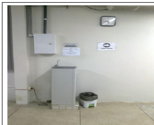
Figura 6 – Bebedouro para uso dos usuários