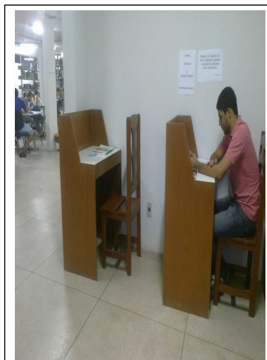
Figura 14 – Cabines individuais de estudo