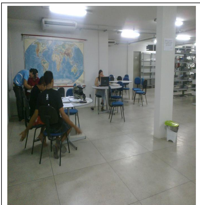
Figura 13 – Ambiente de estudos