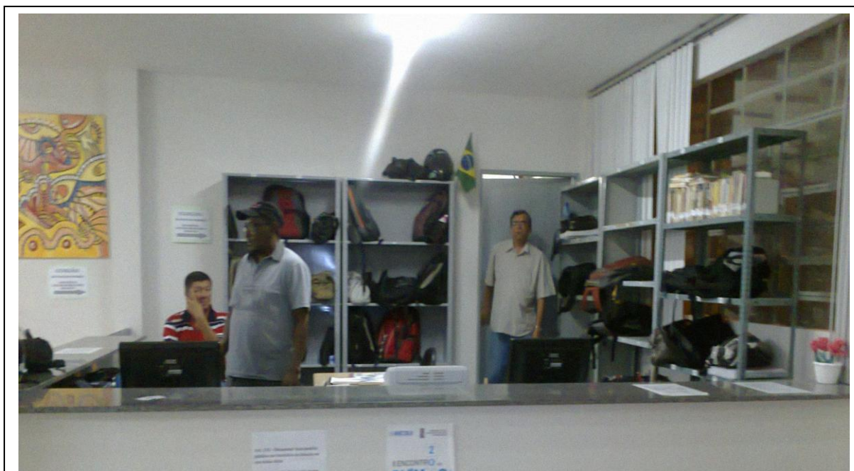
Figura 4 - Setor de Circulação