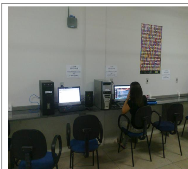
Figura 8 – Espaço para consultar o Portal Capes