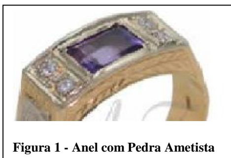
Figura 1 - Anel com Pedra Ametista

Assim passam a ser considerados os símbolos da Biblioteconomia: os emblemas e a cor da pedra ametista, violeta. Como mostrado abaixo: