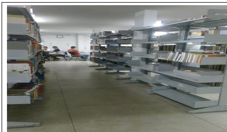
Figura 12 – Espaçamento entre as estantes do acervo