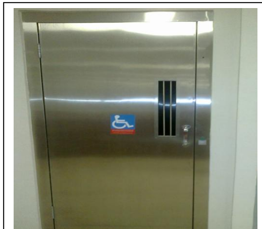
Figura 11 – Elevador