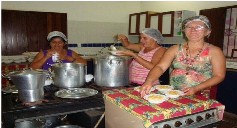
Figura 8 - Mães de crianças que frequentam a Casa dos Sonhos

A Casa dos Sonhos também executa um bom número de atividades que visam o desenvolvimento da comunidade local. Nesse ponto, podemos destacar a força do trabalho voluntário que apresenta algumas ações a partir das aptidões de cada membro envolvido na comunidade. É perceptível, por exemplo, a presença de mães que se dispõem a ajudar nesse trabalho em algumas ocasiões.