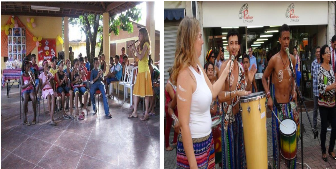
Figura 9 e 10: Educadores e educandos com Projeto musical da Casa dos Sonhos