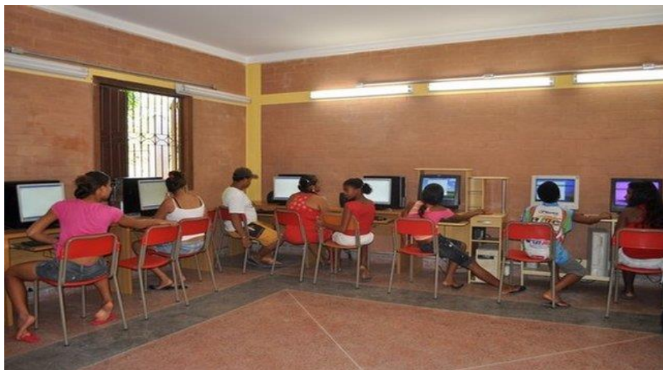
Figura 11 - Sala de informática da Casa dos Sonhos

Percebemos que a Casa dos Sonhos também possui uma preocupação com relação a desenvolver aspectos físicos, a corporeidade nas crianças e jovens daquela comunidade. Por essa razão, ela se utiliza da prática de esportes e de brincadeiras. Crianças e jovens trabalham vários aspectos de suas vidas por meio de brincadeiras e jogos criativos