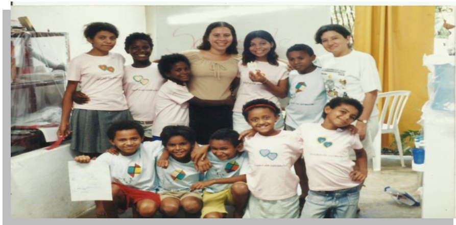
Figura 3: Escolinha Sonho de aprender: “o lugar onde tudo começou”

Os sujeitos da pesquisa são os educadores e as práticas de leitura e ações pedagógicas desenvolvidas na Associação Casa dos Sonhos.