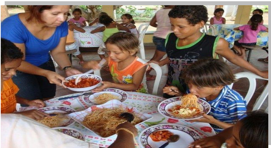
Figura1: crianças almoçando na Casa dos Sonhos

Surgiu como resposta às necessidades de um grupo de crianças e adolescentes desta comunidade que pediam esmolas e trabalhavam catando materiais recicláveis nas ruas de nosso bairro, colaborando com isto ao sustento de suas famílias. Inicialmente nossa ajuda consistiu em dar uma refeição e apoio escolar duas vezes por semana, em nossa casa. Como o numero deles cresceu e não tínhamos condições de atendê-los, nos reunimos com suas famílias, para analisar a necessidade de conseguir um espaço maior para encontros. Eles aceitaram a proposta e deram seu apoio. Pelo que no ano 2003 foi solicitada a ajuda para a compra do terreno e construção do centro na fundação Aiutare Bambini de Itália. Graças a diversos apoios a Casa dos Sonhos abriu suas portas o ano 2004 para acolher 40 crianças. (PROJETO SOCIO-EDUCATIVO CASA DOS SONHOS).