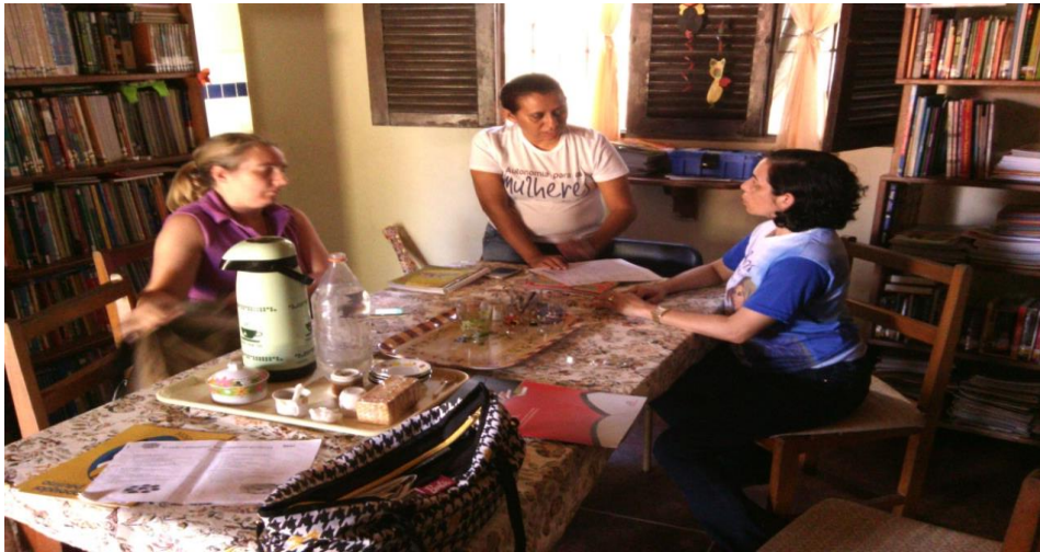
Figura 4 - Momento da entrevista (pesquisadora e educadora da Casa, na sala de leitura)