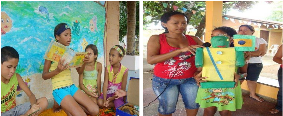
Figuras 5 e 6: Crianças lendo livros de literatura infantil

Sílvia Brenna nos recorda que a prática da contação de histórias feita por ela é dinâmica e envolve todas as crianças. “Desenvolvemos temas através da mediação da leitura e das artes. A contação de história constitui a chave de ingresso para muitas coisas para facilitar aprendizagem da base educativa deles.”