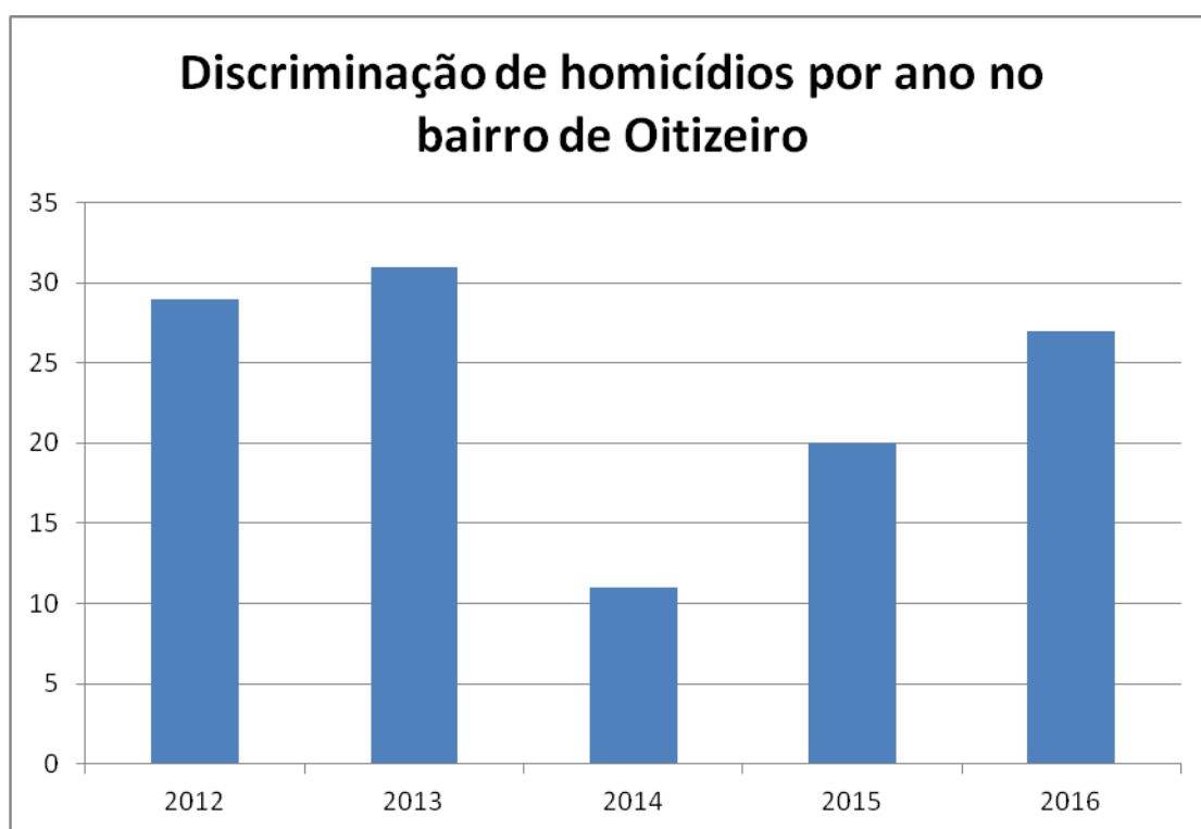
Gráfico 3 – Distribuição de Homicídios no Bairro Oitizeiro por ano (2012-2016).

Os números de homicídios demonstram uma situação aguda da criminalidade violenta no bairro de Oitizeiro, conforme o gráfico 3. Tal realidade foi o que justificou a implantação de uma UPS no bairro, mas observa-se que sua implantação não foi suficiente para incidir sobre os péssimos indicadores de segurança, tendo em vista que houve uma redução importante no ano de 2014, mas o retorno do crescimento, em 2016, a patamares próximos ao verificado nos anos de 2012-2013.