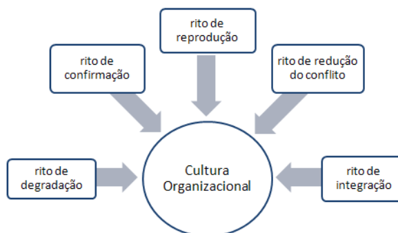
Figura 1: Ritos para definição da Cultura Organizacional

Com o intuito de fazer com que estes elementos da cultura sejam repassados para os demais membros, principalmente os que são novatos, são utilizados diversos meios dentre os quais tem-se os ritos, que para Fischer e Fleury (1989, p. 19) são essenciais para definição e propagação da cultura organizacional, consistindo de um conjunto planejado de atividades e relações elaboradas que combinam várias formas de expressão de cultura, que devem ser expressados e transmitidas. Dentre alguns ritos citados, têm-se os destacados na figura 1: