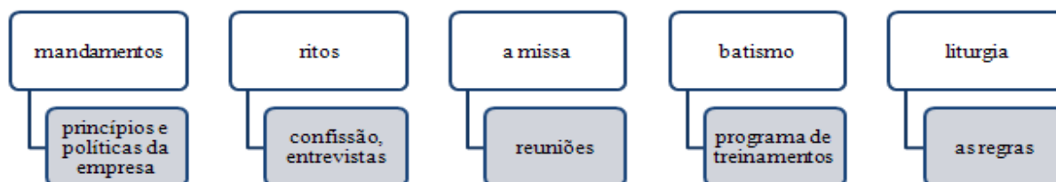
Figura 3: A Cultura Organizacional tida como uma espécie de religião